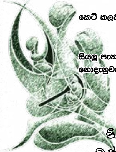
ඩී. එම්. සී. දිල්ලරාක්ෂි බැඳිදැනුම ඉස්තසාලය

කිසිවක් නොදැන මෙලොවට පැමිණ අමරණීය මිනිසුන් ලෙසට කෙටි කලකින් දේපළ වස්තුව නැ පිරිවර තමන් සතු කරගෙන, දිගු කලක් ගෙවීමට සියලු පැනයන්ට විසඳුම් සොයන අතරදී නොදැනුවත්වම දිවිය අවසන් මොහොත පැමිණි වීට, මගේ යැයි රැස්කළ කිසිවකට නොහැක දිවිය රැකීමට