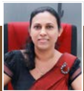
උපදෙස් කော်ට්ටේ මහා නගර සභාවේ නීති නිලධාරී

මෙසේ ඉඩම් ලියාපදිංචි කිරීම් කාර්යාලයේ ලේඛන පරීක්ෂාවට අමතරව අදාළ පළාත් පාලන ආයතනයේද හිමිකම් පරීක්ෂාව සිදුකළ යුතු අතර මේ සඳහා මෙහි පහත සඳහන් ලේඛන පරීක්ෂා කළ යුතුවේ.