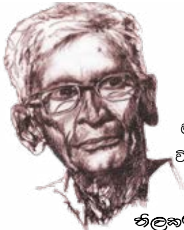
නිලකර්තෘ කුරුමිට කපුකාර

අඟිල් කපුරු හරි වන්දන දීප ධූප දී සුගන්ධයෙන් හන්දින වී දෙරණත පෙරැළී නුබ ගැබවැසි කෙළ සුවහස් දෙවියන්ගෙන් පිහිට පතන වීට, සඳ විජයෙන් ජය ගත් ආමිස්ට්‍රෝංගේ පා රොන් හිසින් රැගෙන දෙවියෝ වනි මහ පොළොවට සාදු හද පවත්වමින්, මානවයන්හට නමස්කර කොට විශ්ව විනාශය වළකාලන ලෙස අයැද සිටීමට