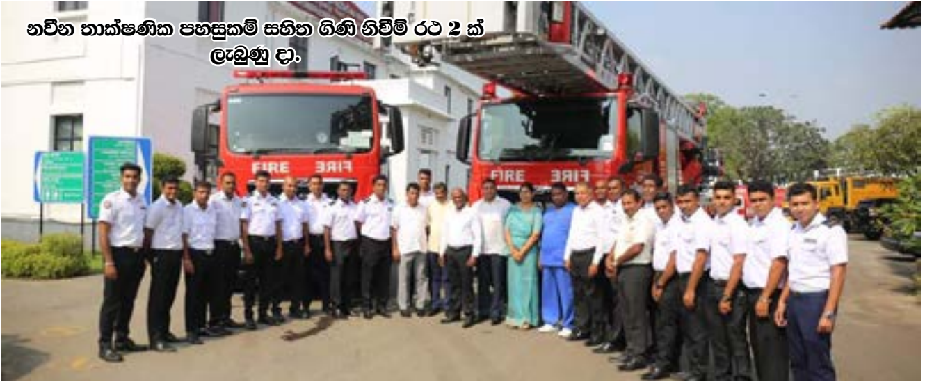
නවීන තාක්ෂණික පහසුකම් සහිත ගිනි නිවීමේ රථ 2 ක් ලැබුණු දා.

ගිනි නිවීමේ පිළිබඳ සහ අනෙකුත් ගිනි නිවාරණයන් පිළිබඳ දැනුම වර්ධනය කරවීම ය.