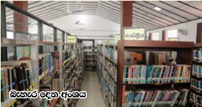
බැහැර දෙන අංශය

මෙම වැඩසටහන්වලදී ඔවුන්ට පොත් පත් කියවීමේ වැදගත්කම, පුස්තකාල මගින් සැලසෙන සේවාව හා අපගේ පුස්තකාල සතු පොත් පත් පිළිබඳ අවබෝධයක් ලබා දී ඔවුන් වෙත පුස්තකාල සාමාජිකත්වය ලබා දීමට කටයුතු කෙරේ.