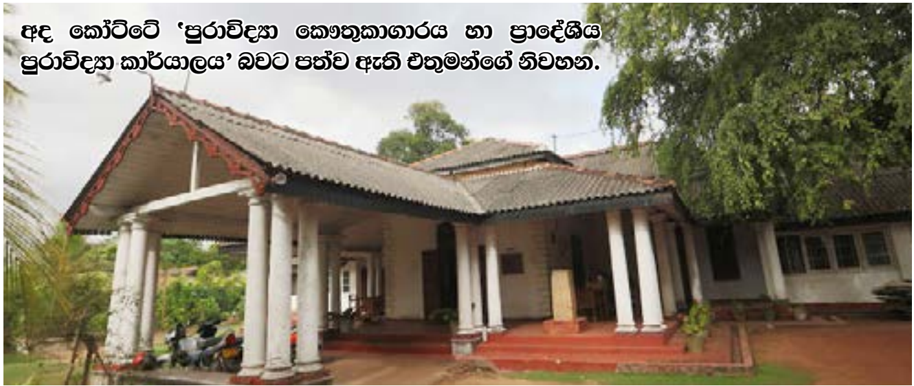
අද කෝට්ටේ 'පුරාවිද්‍යා කෞතුකාගාරය හා ප්‍රාදේශීය පුරාවිද්‍යා කාර්යාලය' බවට පත්ව ඇති එතුමන්ගේ නිවහන.