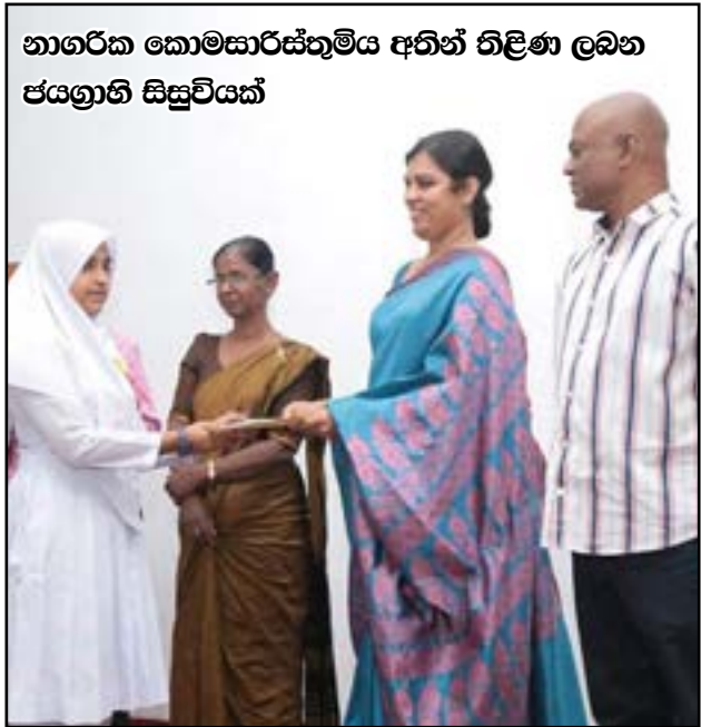
නාගරික කොමසාරිස්තුමිය අතින් නිලිණ ලබන ජයග්‍රාහි සිසුවියක්

විශාකා විද්‍යාලයේ සඳුරා දිත්සඳි යන අය විශේෂයෙන් සිහිපත් කළ යුතුය.