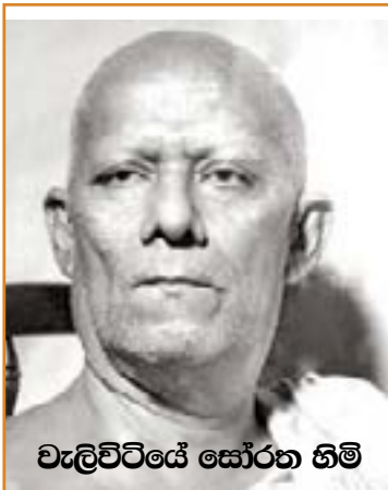
වැලිවිටියේ සෝරත හිමි

කෝට්ටේ යුගය අමතක කර සිංහල සාහිත්‍යයක් පිළිබඳ සිහිපත් කිරීම අසම්පූර්ණ වියමකි. විපමණාටම කෝට්ටේ යුගය හා සිංහල සාහිත්‍යය අතර ඇත්තේ ගසට ඇඳුණු පොත්ත මෙන් වූ අවිශේෂනීය බැඳීමකි.