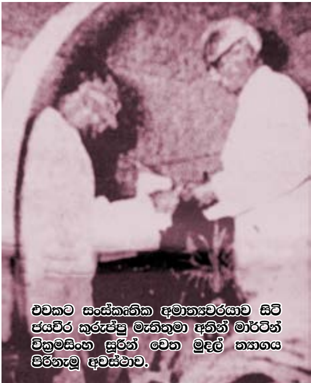
එවකට සංස්කෘතික අමාත්‍යවරයා වූ සිරි ජයවීර කුරුප්පු මැතිතුමා අතින් මාර්ටින් වික්‍රමසිංහ සුරින් වෙත මුදල් ත්‍යාගය පිරිනැමූ අවස්ථාව.

මෙහි ආරම්භක උත්සවය අග්‍රාමාත්‍ය එස්. ඩබ්ලිව්. ආර්. සී. බණ්ඩාරනායක මැතිතුමාගේ ප්‍රධානත්වයෙන් අගෝස්තු 07 වැනි දින ඇතුල්කෝට්ටේ සිරි පැරකුම්බා පිරිවෙනේදී පැවැත්විණි. මෙහි ප්‍රධාන තේමාව වූයේ 'කෝට්ටේ යුගයේ සාහිත්‍යය' යි.