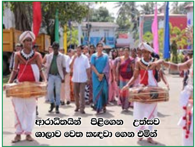
ආරාධිතයින් පිළිගෙන උත්සව ශාලාව වෙත කැඳවා ගෙන එමින්

සිදුවිය. මෙය කෝට්ටේ මහජන ප්‍රස්තකාලයන්හි පරිහරණය උදෙසා සම්පාදනය කර ඇත.