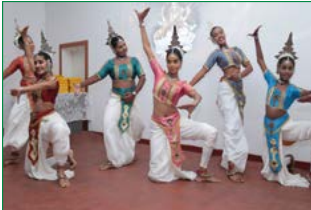
උළෙල විවිචුවත් කරමින් කෝට්ටේ ආනන්ද බාලිකා විදුහලේ ශිෂ්‍යාවන් පිරිසක් විසින් ඉදිරිපත් කළ නර්තනය